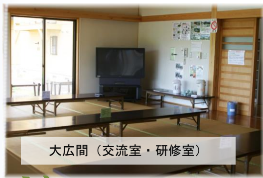
大広間 (交流室・研修室)