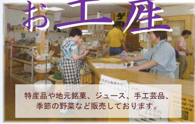
特産品や地元銘菓、ジュース、手工芸品、季節の野菜など販売しております。