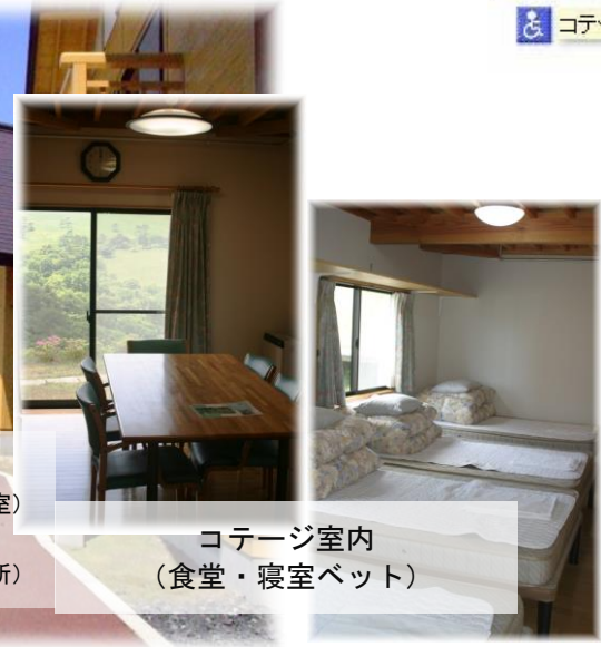
コテージ室内 (食堂・寝室ベット)