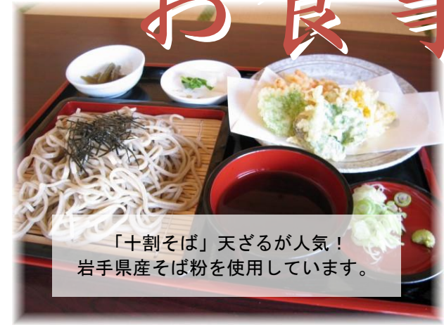
「十割そば」天ざるが人気！ 岩手県産そば粉を使用しています。

室根高原のロケーションが自慢の宿泊施設。アウトドアや乗馬体験した後にコテージや大浴場でリフレッシュ！