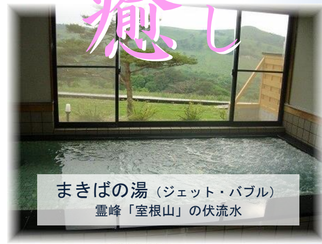
まきばの湯 (ジェット・バブル) 霊峰「室根山」の伏流水